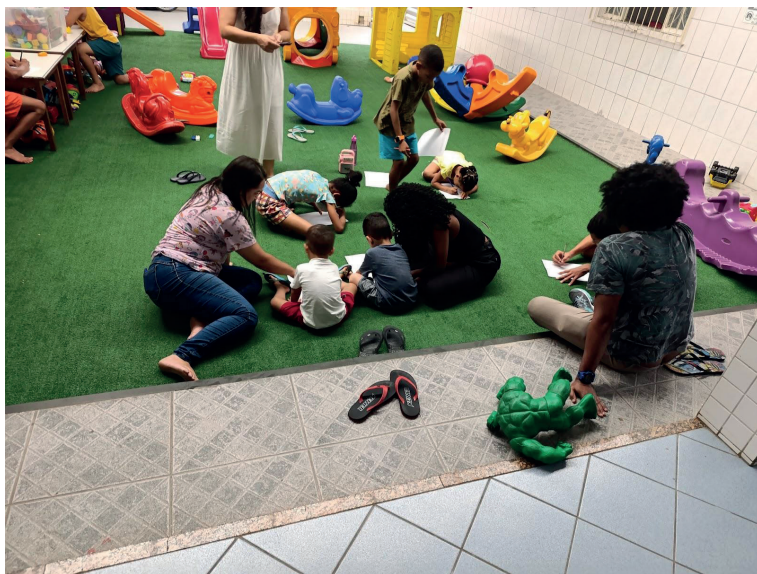
Figura 3 – parecer descritivo de uma avaliação de criança do abrigo.

No terceiro encontro, buscou-se consolidar os aprendizados anteriores, reforçando a relação entre memória, identidade e convivência coletiva. Atividades musicais e corporais evidenciaram a importância do outro na construção das experiências e das lembranças compartilhadas. O encerramento da oficina envolveu registros avaliativos por meio de desenhos e textos, a entrega dos livros de memória e fotografias produzidas, além de um momento de confraternização, marcado pelo reconhecimento da experiência vivida e pelo fortalecimento dos vínculos estabelecidos.