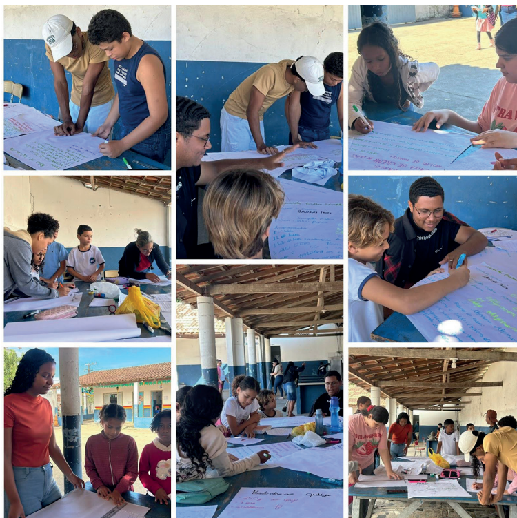
Figura 6 – Avaliação do encontro por uma criança.