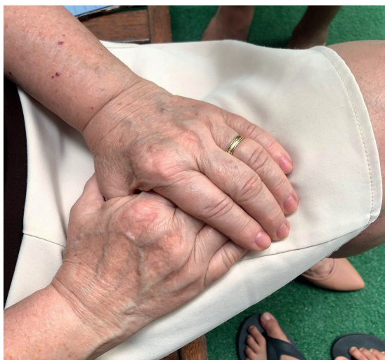
Figura 1 e 2 – Fotos tiradas pelas crianças no momento da oficina de fotografia.